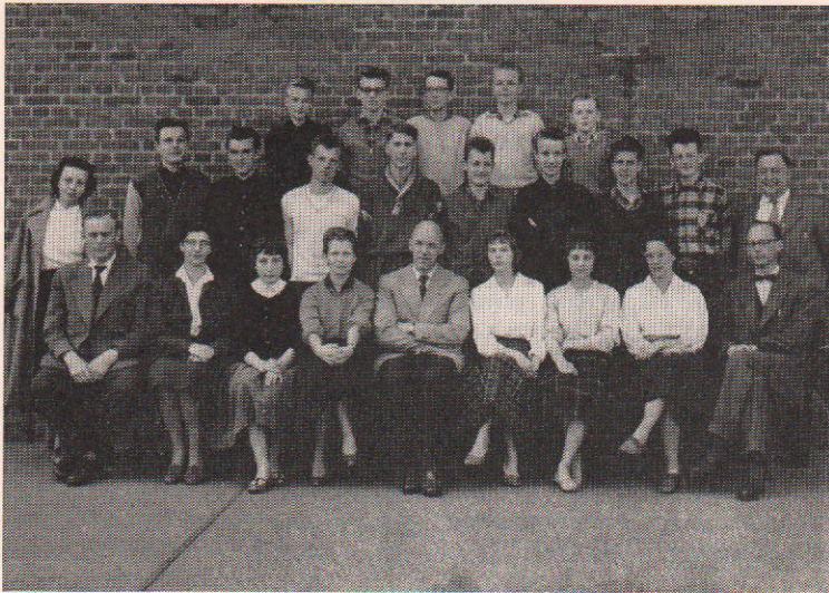
Realklassen 1959 ved Ørnevejens skole