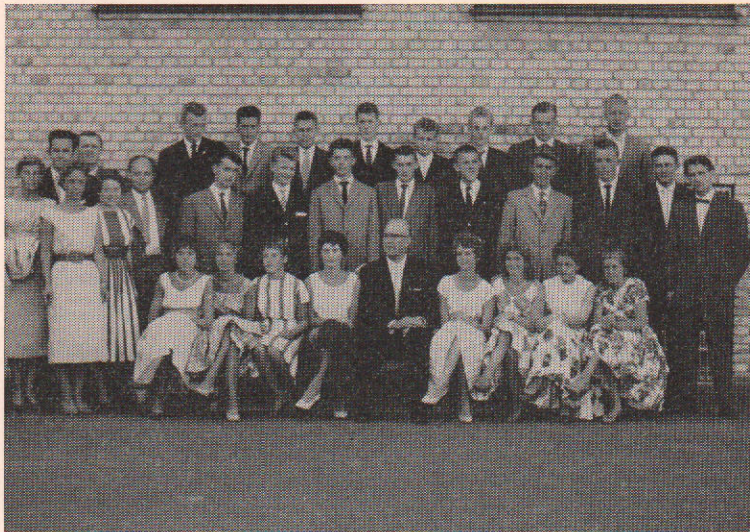
Realklassen 1959 ved Fladstrand skole