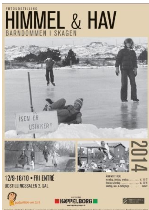
Barndommens gade i Skagen 2014

I 2014 afholdt Frederikshavn Kommune en pædagogisk konference med titlen Barndommens Gade. Den blev afholdt i Skagen, og i den forbindelse lavede Stadsarkivet i samarbejde med Lokalthistorisk Forening i Skagen en fotoudstilling med billeder, der dokumenterede barndommen i Skagen igennem tiden.